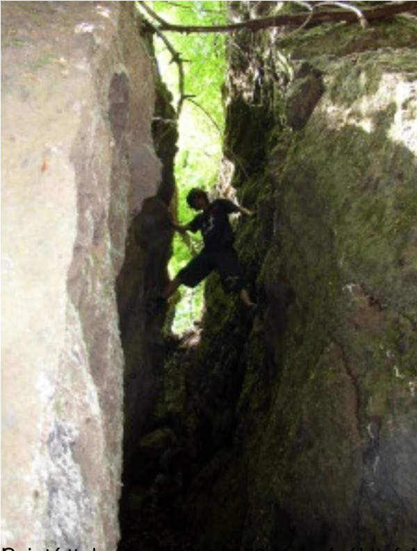
Rejtőbányán a kőbe vájt szikrákban a falon át kaptuk a jöhetélt, majd az éltől egy ápoltsírhant