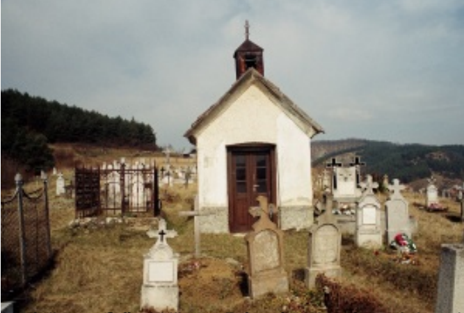
Az ápoltsírhant a kőbe vájt szikrákban a falon át kaptuk a jöhetélt, majd az éltől egy ápoltsírhant